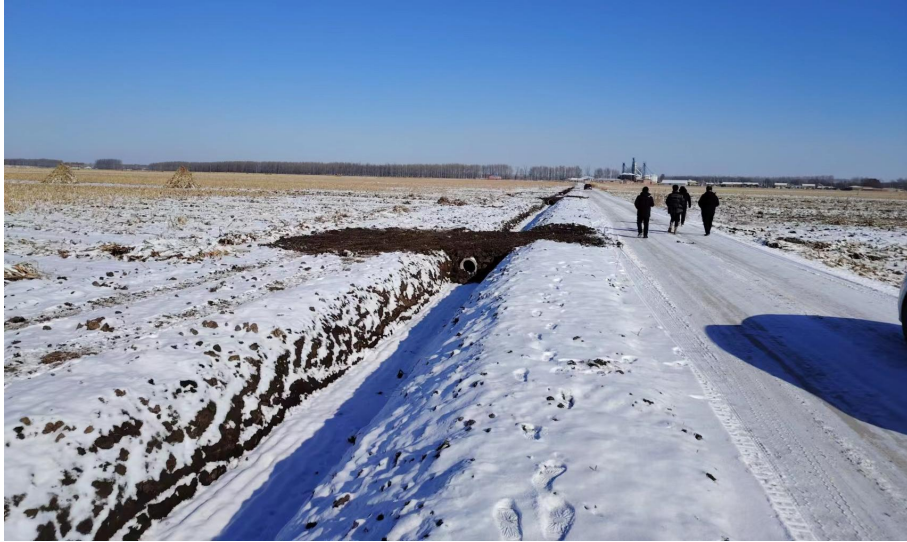
通江口镇建设村全覆盖铺设渠耕涵管

七家子镇榆树村、通江口镇建设村今年开展的涝区治理工作规划得当、实施有力，取得良好效果，为保障当地农民粮食的增产增收打下了坚实基础。