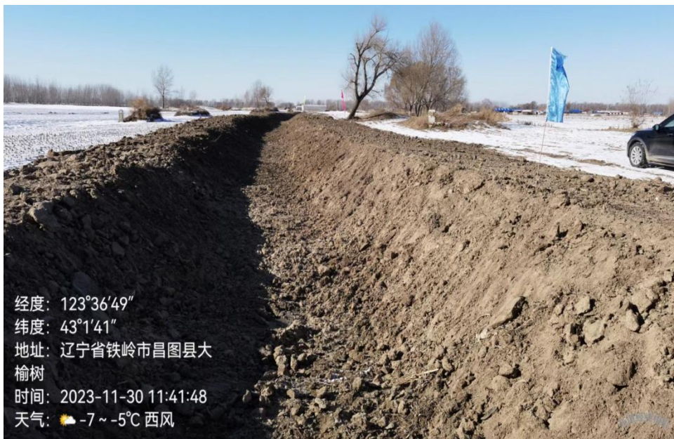
七家子镇榆树村修建的高标准排涝支渠

该村目前常备 3 台大型挖掘机，长期值班值守，闻令而动，随时准备为申请清理沟渠的村民服务。