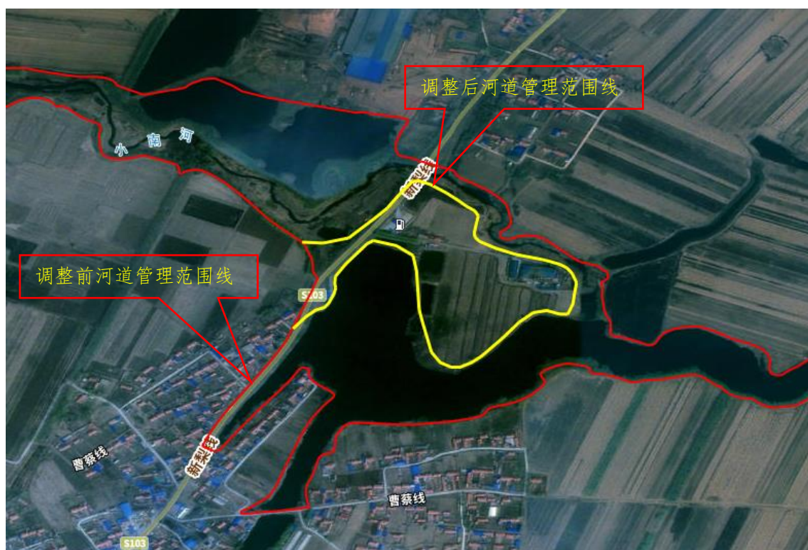
图 1 小南河局部河道管理范围线调整图

根据铁岭市水务局《关于对河道管理范围划定成果进行复核和应用的 通知》要求，通过对十年一遇水位复核，水位全在河槽内，以自然岸坎为边界向外 5m 对小南河河道管理范围线调整 1 处。调整图如下：